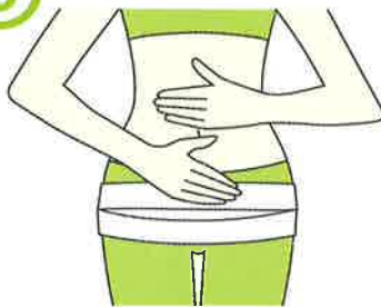
健美ベルトのできあがり(前)