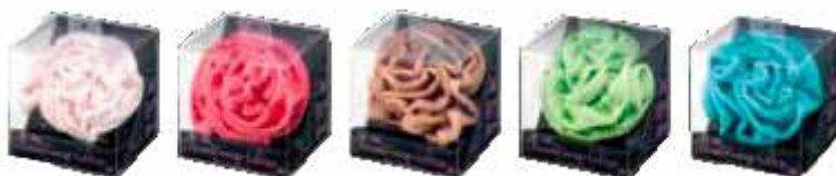
ピンク フランボワーズ ミルクココア ピ스타チオグリーン ミントブルー

これから子育てをはじめのおかあさん、子育て中のおかあさんのお風呂上がりに重宝します。 ツバキオイル配合繊維なので、べつつかないのに髪ツヤツヤ！